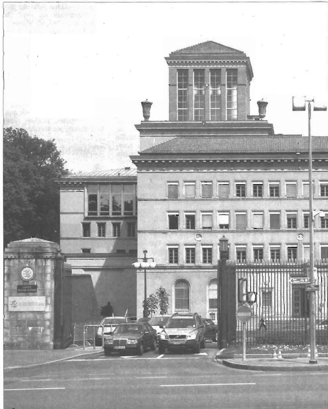
Le centre William-Rappard. L'Organisation mondiale du commerce est à l'étroit dans son siège genevois. Elle souhaite l'agrandir et l'entourer d'un périmètre de sécurité.